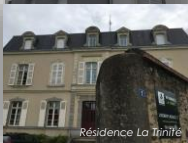
Résidence La Tinière