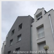
Résidence René PERREAULT